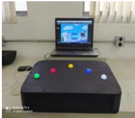
FIGURA 1. Dispositivo e jogo elaborado no Núcleo de Pesquisa e Tecnologia