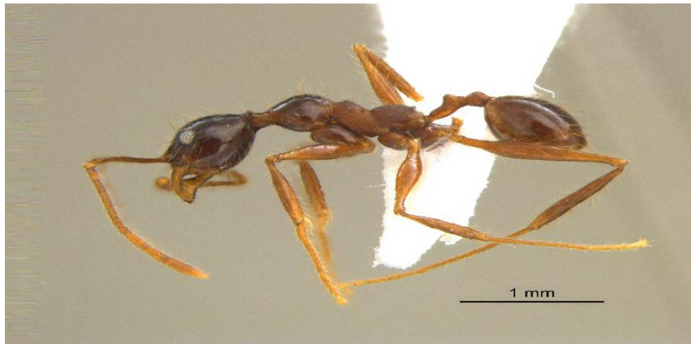
Figura 2 - Operária menor de Pheidole tijucana em vista lateral.

Encontramos 12 guildas, sendo as predadoras generalistas (65,72%), onívoras dominantes de solo ou serapilheira (15,60%) e Mirmicíneas (8,48%) (Figura 3) as mais frequentes. Consideradas predadoras especialistas, a ocorrência de Strumigenys denticulata indica que o ambiente pode apresentar características naturais da paisagem que possibilitam a permanência destas espécies (KOWARIK, 2011). Mas, apesar de o parque apresentar um alto número de guildas, a maioria possui hábitos generalistas. Neste caso, são formigas que utilizam diferentes itens alimentares e são facilmente encontradas em ambientes com algum grau de antropização (BRANDÃO et al. , 2009).